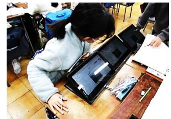
5年 流れる水のはたらき

学習面では、今年度の4月から子どもたちに配られたタブレットが、授業の中で活用されています。5年生の理科「流れる水のはたらき」では、上流・中流・下流の様子を3台のタブレットに映しながら違いを比べていました。一つの河川だけではなく、複数の川を見比べることで共通の特徴に気付いていました。