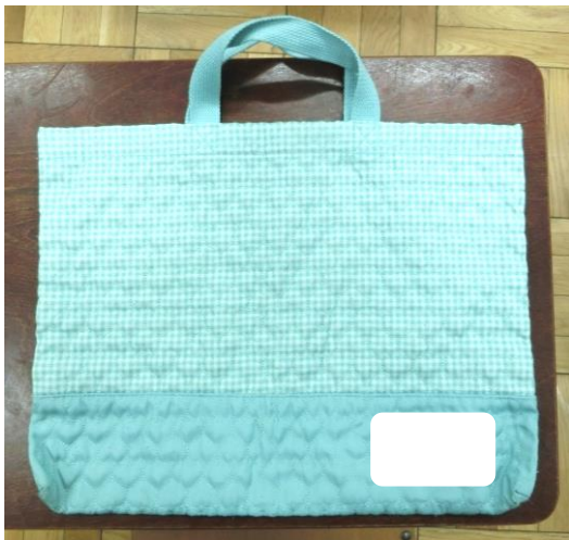
★手さげ袋（図書バッグ）